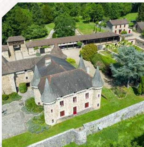
Domaine de Vieillecour